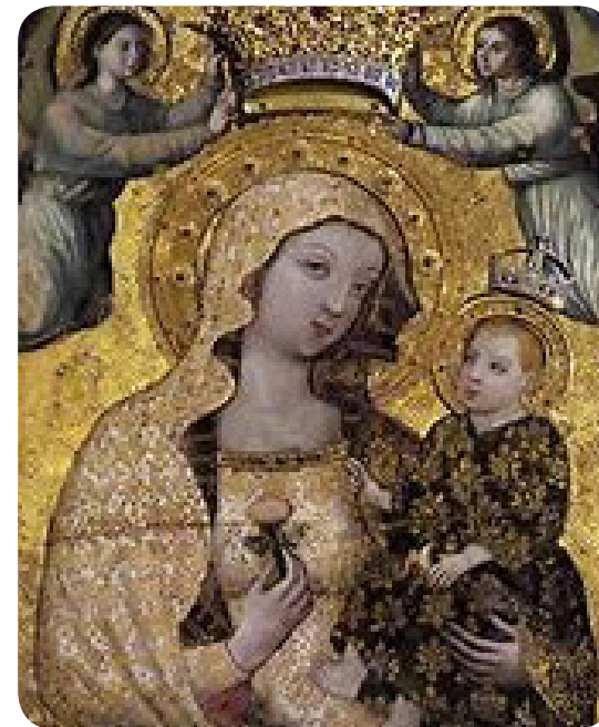
Virgen de la Antigua (塞维利亚主教座堂著名的十五世纪圣母像)

亲爱的朋友你想认识耶稣吗？你想寻找人生的真理和意义吗？走近耶稣你就会获得人生的真理和意义，你就会获得永恒的生命。“我是道路、真理、生命，除非经过我，谁也不能到父那里去。”（若望福音14：6）你有人生的劳苦和重担吗？走到耶稣跟前交给他，你必会获得内心的平安与安息。“凡劳苦和负重担的，你们都到我跟前来，我要使你们安息。”（玛窦福音11：28）你想获得圆满的喜乐吗？寻找耶稣吧！只有在他那里我们才能获得人生圆满而无缺的喜乐。“我对你们讲论了这些事，为使我的喜乐存在你们