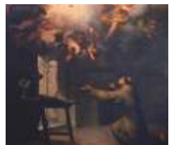
CAPELA DE SANTO ANTÓNIO Linha da visão de Santo António, B. E. Murillo, Séc. XVII