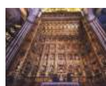
ALTAR MAIOR. Pyeter Dancart, Jorge Fernández Alemán, Alejo Fernández, Roque de Balduque, Juan Bautista Vázquez Séc. XV e XVI