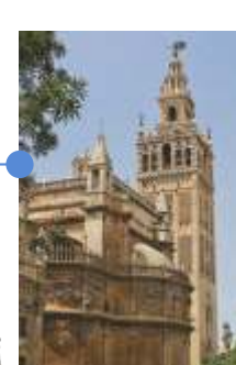
TORRE DA GIRALDA. Ben Basso, Séc. XII