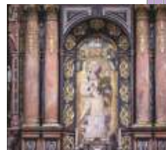
CAPELA DA VIRGEM DA ANTIGA Anónimo Séc. XIV