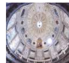
SALA CAPITULAR Hernán Ruiz Séc. XVI