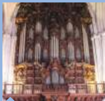
ÓRGÃOS DA CATEDRAL Duque Cornejo, Séc. XVIII