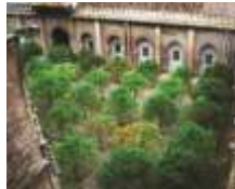
오렌지 나무 파티오 (안뜰) 벤 바소 17세기