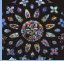
장미창 비센테 메나르도 16세기