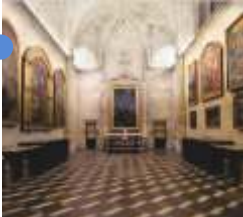
성배실 마르틴 데 가인사 16세기