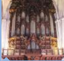
대성당 오르간 두케 코르네호 18세기