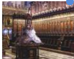
성가대석 누프로 산체스 15세기