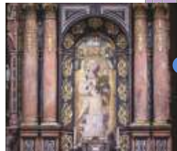
안티구아 성모 마리아 예배당 작가 미상 14세기