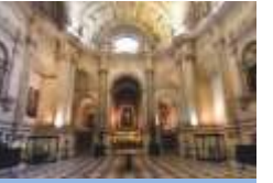
주 성구실 디에고 데 리아노 16세기