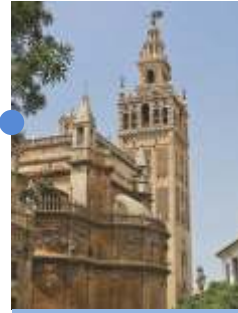
히랄다 탑 벤 바소 17세기