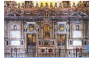
성가대석 뒤쪽 루이스 곤살레스 17세기