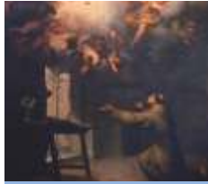
성 안토니오 예배당 성 안토니오의 견신화, B.E. 무리요 17세기