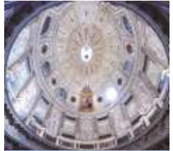
참사회의실 에르난 루이스 16세기