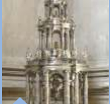
아르페 성궤 후안 데 아르페, 18세기 주 성구실