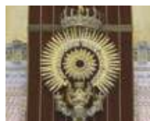
은 제단 또는 후빌레오 (교황의 특사) 제단 후안 라우레아노 데 피나 18세기