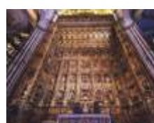
主祭壇 ピーテル・ダンカート ・ホルヘ フェルナンデス・ アレマン・アレホ フェルナンデス、ロケ ・デ・バルデュケ、ファン ・パウティスタ・ベラスケス 19世紀および6世紀