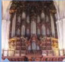
大聖堂のオルガン デュケ・コルネホ 18世紀