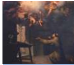
サンアントニオ礼拝堂 Lienzo de la visión de San Antonio, B. E. ムリーリョ 17世紀