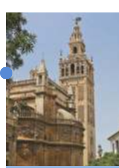
ヒラルダの塔 ベン・パッソ 12世紀