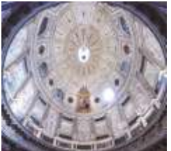
参事会室 エルナン・ルイス 16世紀