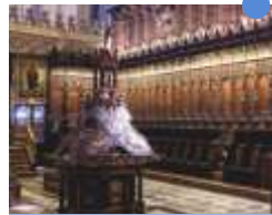
聖歌隊席 ヌフロ・サンチェス 15世紀