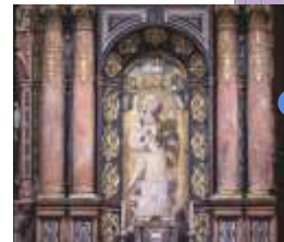
ラ・アンティギア聖母礼拝堂 作者不詳 14世紀