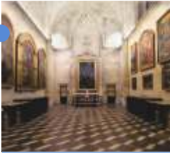
聖具納室 マルティン・デ・ガインサ 16世紀