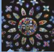
薔薇窓 ヒセンテ・メナルド 16世紀