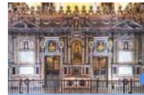
祭壇背後部 ルイス・ゴンサレス 17世紀