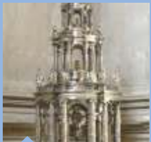
OSTENSORIO DI ARFE Juan de Arfe, sec. XVIII Sagrestia Maggiore