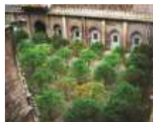
CORTILE DEGLI ARANCI Ben Basso sec. XII