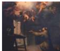
CAPELLA DI SANT' ANTONIO Dipinto della visione di Sant'Antonio, B.E. Murillo, sec. XVII