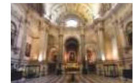
SAGRESTIA MAGGIORE Diego de Riano sec. XVI