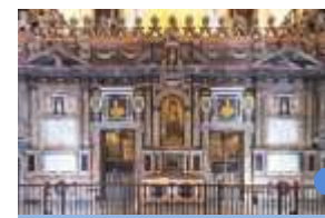
RETROCORO Luis González sec. XVII