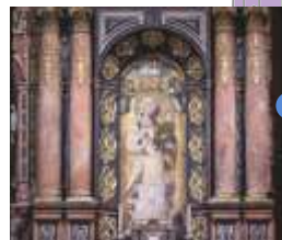
CAPELLA DELLA MADONNA DI ANTIGUA Anonimo s. XIV