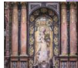
KAPELLE DER JUNGFAU VIRGEN DE LA ANTIGUA Anonymer Künstler, 14. Jh.