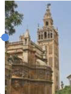
TURM DER GIRALDA Ben Basso, 12. Jh.