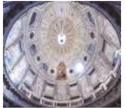
KAPITELSAAL Hernán Ruíz, 16. Jh.