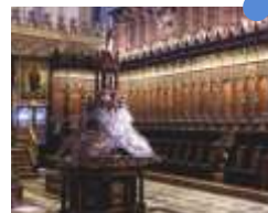
CHOR. Nufro Sánchez, 15. Jh.