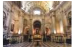
HAUPTSAKRISTEI Diego de Riaño, 16. Jh.