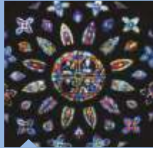
ROSETTE Vicente Menardo, 16. Jh.