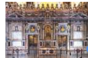
TRASCORO (RÜCKSEITE DES CHORS) Luis González 17. Jh.