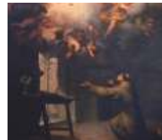
KAPELLE VON SAN ANTONIO Gemälde der Vision des Hl. Antonius, B.E. Murillo, 17. Jh.