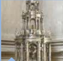
MONSTRANZ VON ARFE Juan de Arfe, 18. Jh. Hauptsakristei