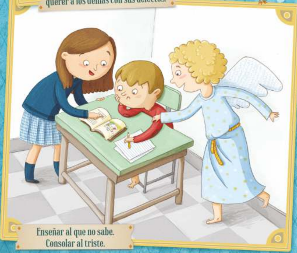
Enseñar al que no sabe. Consolar al triste.