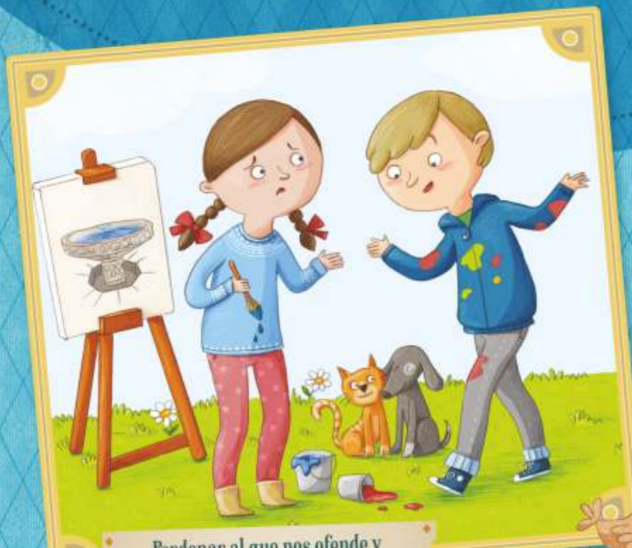
Perdonar al que nos ofende y querer a los demás con sus defectos.

Si practicamos estas obras con los demás, seremos más felices y sentiremos el gran abrazo de Dios.