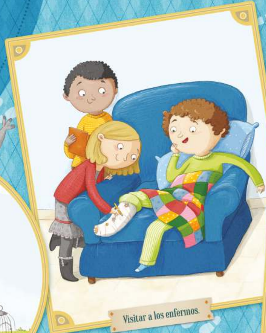
Visitar a los enfermos.