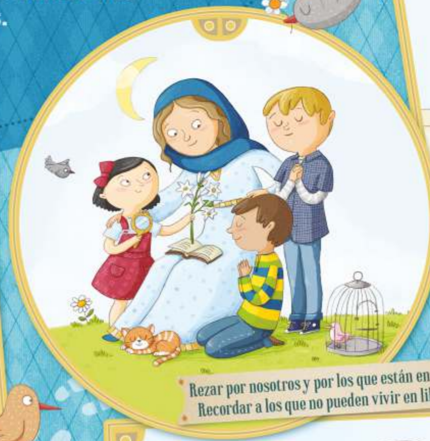
Rezar por nosotros y por los que están en el Cielo. Recordar a los que no pueden vivir en libertad.