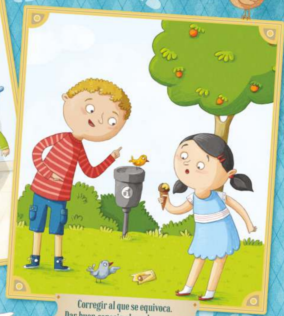
Corregir al que se equivoca. Dar buen consejo al que lo necesita